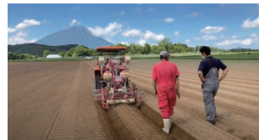
北海道虻田郡留寿都村 - 大根の播種と成形作業