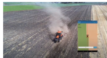
北海道旭川市鈴木農場 - 田植機からスタブル向けトラクタに載せ替えて