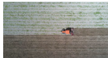
長崎県諫早干拓 - 耕起用トラクタで600mの直線を自動操舵