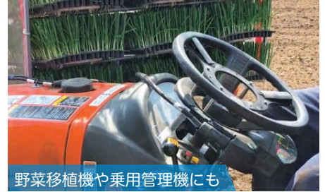
野菜移植機や乗用管理機にも